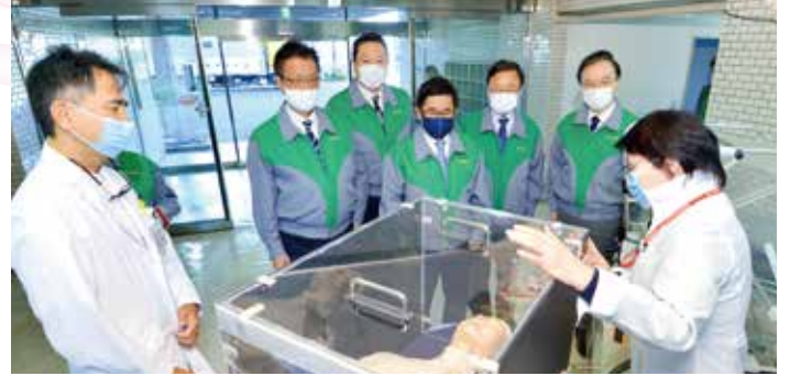
▲コロナ専用病院の運営について説明を聞く高倉都議(後列右端)

公明党中野総支部長の高倉良生(東京都議会議員)は、区議会公明党と連携してコロナ禍における区民の安全・安心をめざして奮闘しています。都議会では政策立案の要である党の政務調査会長として、都民の命と生活を守る政策実現に全力を尽くしています。